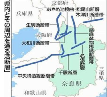
県内とその周辺を通る活断層

地震、停電、渇水の3つの災害について、それぞれ数値化して総合判断し、浄水場を集約した方が安定供給性の向上が図れるという評価になった。