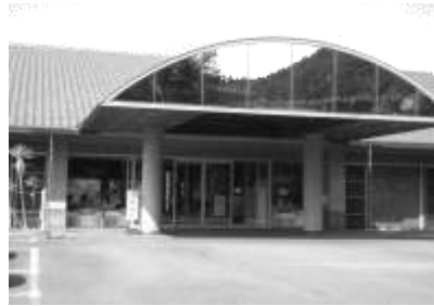
桜井市総合福祉センター「竜吟荘」