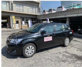
上之郷、高家デマンドタクシー