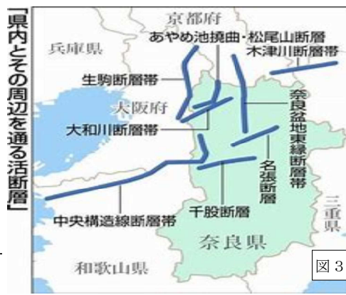
図3 県内とその周辺を通る活断層

世界で大きな戦争が起こっている現在、核兵器使用の危機が増大しています。ヒロシマ・ナガサキの悲劇を繰り返さないために、核の脅威について考えましょう。