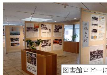
図書館ロビーにて

世界で大きな戦争が起こっている現在、核兵器使用の危機が増大しています。ヒロシマ・ナガサキの悲劇を繰り返さないために、核の脅威について考えましょう。